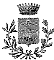
Praia a Mare Comune Capofila